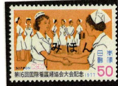
1977年 第16回国際看護婦協会大会