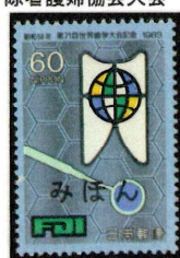
1983年 第71回世界歯学大会