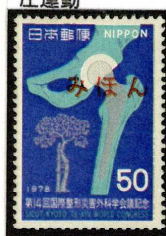
1978年 第14回国際整形災害外科学会議