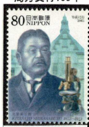
2003年 北里柴三郎(第2次文化人)