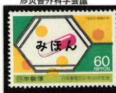
1986年 日本薬局方交付100年