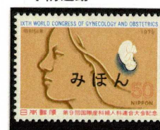
1979年 第9回国際産婦人科連合大会