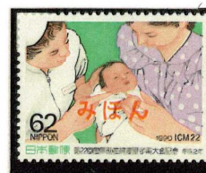
1990年 第22回国際助産婦連盟学術大会