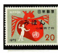
1972年 心臓病予防運動