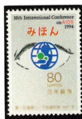
1994年 第10回国際エイズ会議