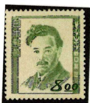
1949年 野口英世 (第1次文化人)