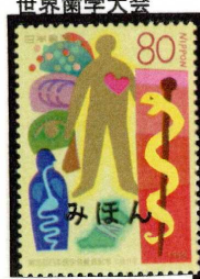
1999年 第25回日本医学会総会