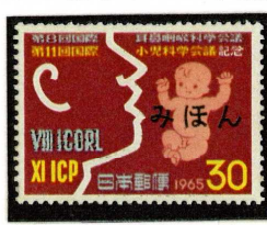
1965年 国際耳鼻咽喉・小児科学会議