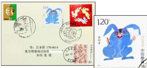
○兎年用年賀切手発行初日特印カバー