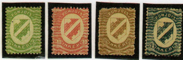
1920. 3. 21 普通 Sc-FI:NI1~4

封書 消印：1920. 12. 4 消印局：キルヤサロ (KIRJASALO) 切手：1920. 8. 2 普通 Sc-FI:NI8 9 10 11 12