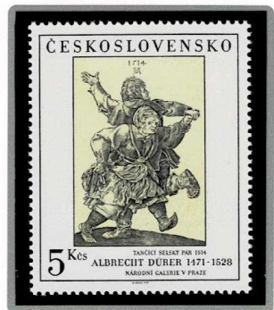
踊る農夫のペア 1514年制作 1979年発行