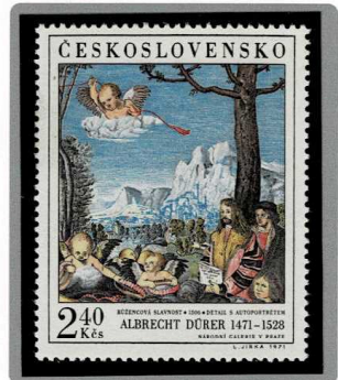
「バラの冠の載冠式」(部分) 1506年制作 1971年発行