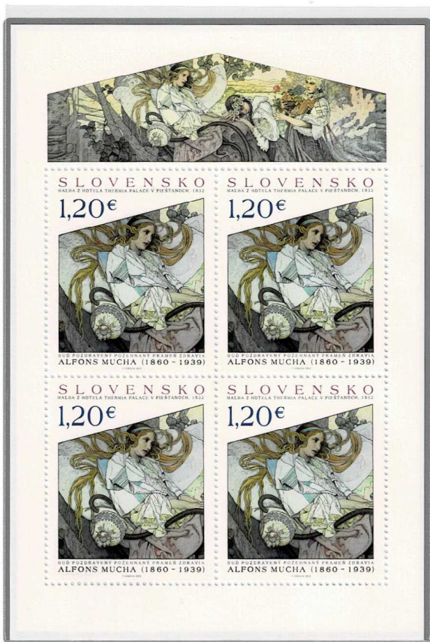
シート上部に壁画全体を配する

チェコスロヴァキアの画家。女優サラ＝ベルナルのポスターを手がけたことで名声を得る。女性に花や流線を組み合わせた華麗なデザインで、アールヌーボーを代表する人物となった。*