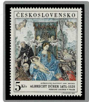
「バラの冠の載冠式」(部分) 1506年制作 1968年発行