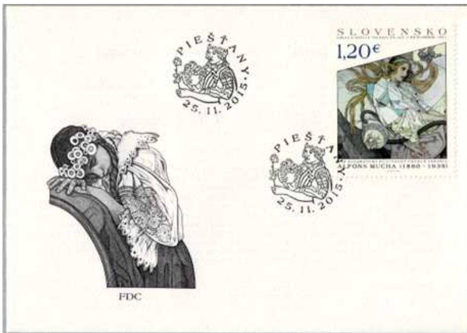
アルフォンス・ミュシャ「健康であれ、健康の祝福の泉で」1932年制作

今回紹介するチェコの絵画切手は、チェコスロヴァキアから1966年から発行された美術切手シリーズが中心です。1993年チェコとスロヴァキアに分離後は、チェコで引き継がれましたが、スロヴァキアからも同じフォーマットで発行されており、併せて紹介しています。単片が基本となりますが、FDC、MCカード、4面シートも適宜加えました。原則制作年順に整理し、同じ画家の作品はできるだけまとめています。時代分類、画家名、作品名等については、市川敏之氏の著書「チェコスロヴァキア美術館」 1) を参考にしました。