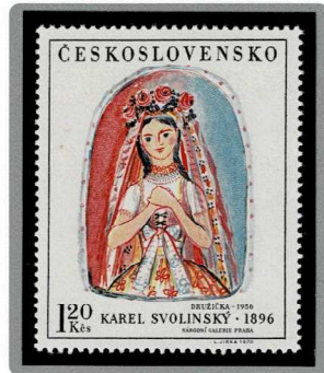
花まき娘 1956年制作 1970年発行