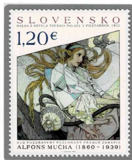
健康であれ、健康の祝福の泉で (ミュシャの娘を描いた部分) 1932 年制作 2015 年発行