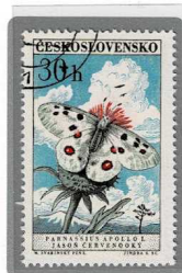
アポロウスバ シロチョウ