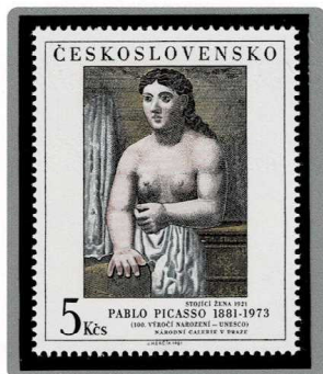
立っている女 1921年制作 1981年発行

スペインの画家。主にフランスで活躍。ブラックとともにキュビズムを創始したのをはじめ、次々と現代美術の新しい領域・様式を開拓、二〇世紀美術に大きな足跡を残した。*