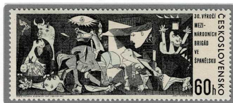
ゲルニカ 1937年制作 1966年発行