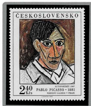
自画像 1907年制作 1972年発行