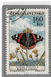
ヨーロッパ アカタテハ