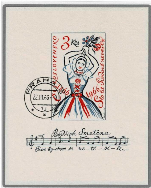
売られた花嫁 1966年制作 1966年発行