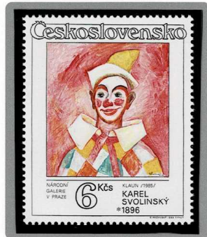
道化師 1985年制作 1986年発行