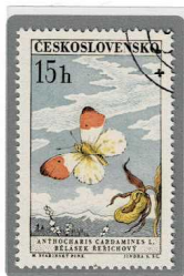
クモマツマキチョウ