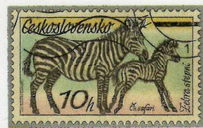
9 チェコスロバキア