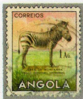
3 アンゴラ (ポルトガル領)