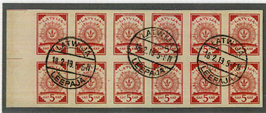
LATVIJA 1919. 2. 18 LEENAJA (リエパーヤ)