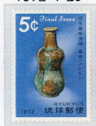
琉球最後の切手 1972・4・20

戦後、米国の施政権下に置かれた沖縄が1972年5月15日に「希望」を抱き日本に復帰して、来年で50年になるが、今も沖縄県には在日米軍専用施設の約70%が集中し、県民が求める基地の撤去や大幅縮小は実現しないはまだ。「沖縄は何も変わっていない」。