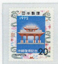
沖縄復帰記念切手 1972・5・16

戦後、米国の施政権下に置かれた沖縄が1972年5月15日に「希望」を抱き日本に復帰して、来年で50年になるが、今も沖縄県には在日米軍専用施設の約70%が集中し、県民が求める基地の撤去や大幅縮小は実現しないはまだ。「沖縄は何も変わっていない」。