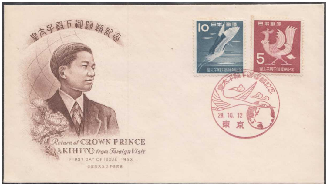
皇太子殿下御帰朝記念 S28(1953). 10. 12 発行

戦前の記念切手は皇室関係のものがかなりの部分を占めていましたが、戦後は減りました。それでも数年に一度位のペースで、今に至るまで発行が続いています。