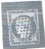
15c yel grn, grnsh