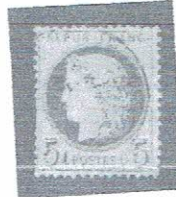
5c yel grn, pale bl