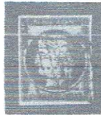
20c blk, yeish