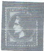
20c bl, bluish