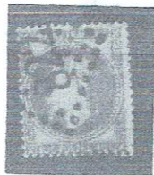
40c org, yelsh