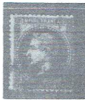
80c rose pksh