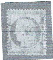
10c bis, rose