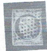
40c org, yeish