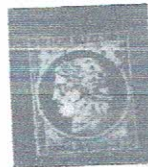
25c lt bl, bluish