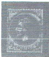
2c red brn, yelsh