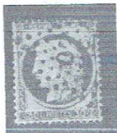
30c brk, yelsh