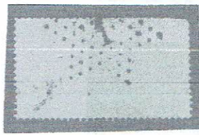
5fr lil, lav