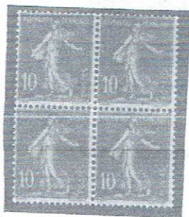
10c red (土地あり)