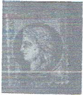
10c bis, yelsh