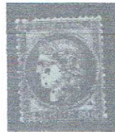
80c rose pnksh