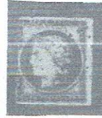
1fr dull org red