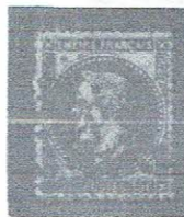
30c brn, yelsh