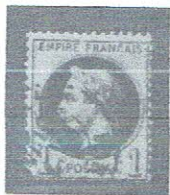
1c brnz grn, pale blue