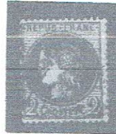
2c red brn, yelsh