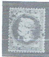
10c bis, yelsh