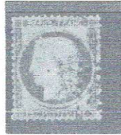
15c bis, yelsh