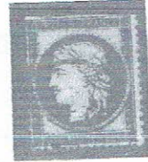
25c bl, bluish