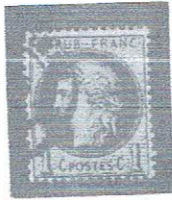
1c olgrn, pale bl