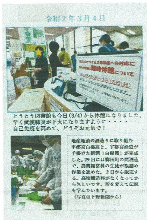
とうとう図書館も今日(3/4)から休館になりました。早く武漢肺炎が下火になりますように・・・自己免疫を高めて、どうぞお元気で!

なお、両葉書とも文面に「武漢肺炎」の記載があるが、本ウイルスの発生当初は感染源とされる都市の名前を冠し、今次感染症を「武漢肺炎」と呼ぶ風潮にあった。しかし、日本脳炎やスペイン風邪の様な過去の例はあるものの、風評被害等を防ぐために都市名等はウイルス名に付けないとする世界保健機構の基準に則った報道がなされるようになること、日本国内でも徐々に「新型コロナウイルス感染症」の呼称が定着することとなった。