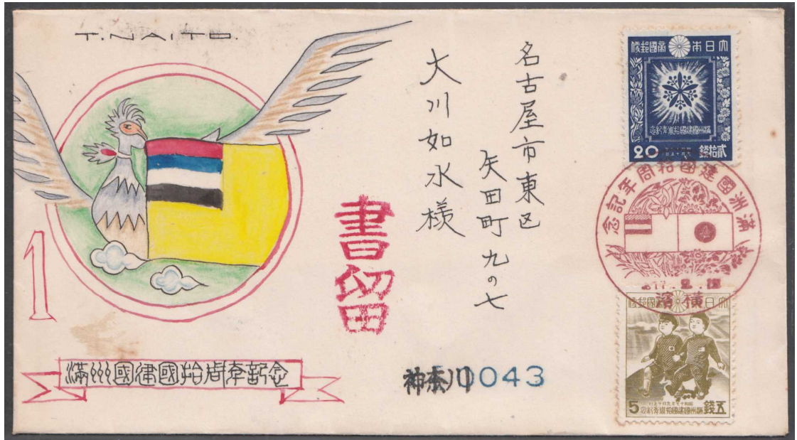
横浜 17.9.15 特印 神奈川局引受