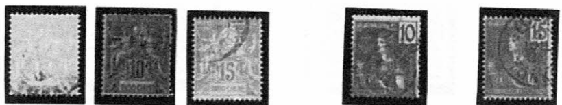
1892～1900 普通 (平和と通商) Sc-FR: IC7 8 II