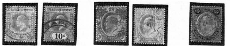
1902 普通 1906~11 1908~11

Sc-SG: ST73 74 Sc-SG: ST83 85 87 Sc-SG: ST91 普通 (ヴィクトリア女王) 普通 (ヴィクトリア女王) ヴィクトリア女王