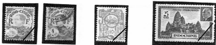
1922～1923 (普通) Sc-FR: IC94 101 インドシナの女性