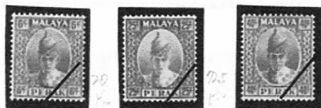
1938~1941 普通 Sc-MY:PK88 92 94 スルタン イスカンダル