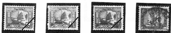
1931～41 普通 Sc-FR: IC143, 144, 145 (ジャンク) 155 (アンコール)