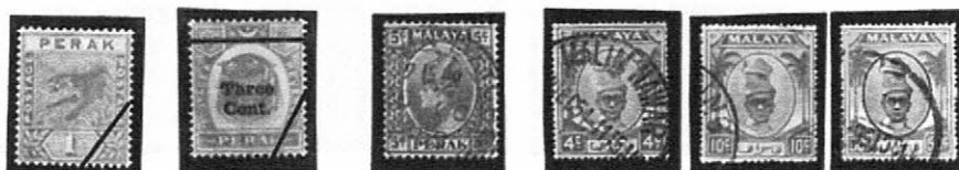
1892~95 1900 普通 1935~37 1950. 8. 17 普通 Sc-MY:PK42 Sc-MY:PK65 Sc-MY:PK72 Sc-MY:PK108 111 116 普通 (トラ) トラ 普通 (スルタン イスカンダル) スルタン ユスウ