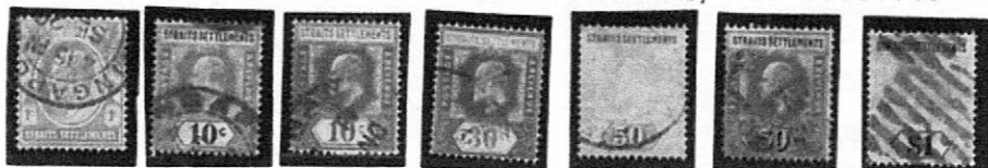
1904~1911 普通 (エドワード七世)

Sc-SG: ST93 98 普通 (エドワード七世) 普通 (エドワード七世) Sc-SG: ST130 134 Sc-SG: ST148 エドワード七世