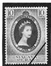
1953. 6. 2 記念 Sc-MY:PK126 エリザベス二世戴冠式