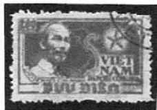
1954. 10 普通 Sc-VN14 ホーチミンとベトナムの地図