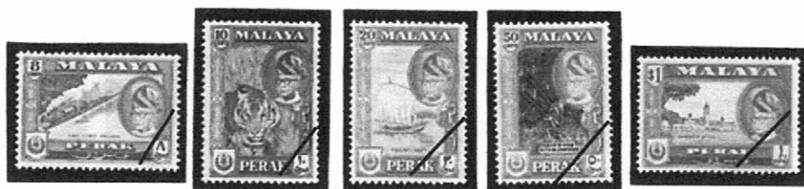
1957~1962 普通 (スルタンと風景) Sc-MY:PK127 (コブラ) 12 8 (パイナップル) 129 (米田) 130 (モスク) 131 (東岸鉄道) 132 (トラ) 133 (釣り船) 134 (アボリジノの吹き矢) 135 (政庁舎)