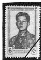
1943 普通 Sc-FR: IC226 ノロドム・シハモニ

フランスは、19世紀末から現在のベトナム、ラオス及びカンボジア地域をフランス領インドシナとして占領支配し、切手を発行していた。