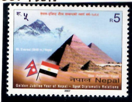
エヴェレストとギザのピラミット (ネパール・エジプト国交50年)