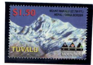
Spanish Kangchungtse(Makalu II) Expedition '92(Autumn)