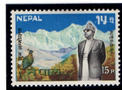
ナムチャバザールからのエヴェレスト(国王の顔の左側に望める)