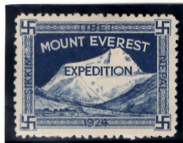
1924年使用のエヴェレストを描いた最初のシール