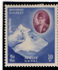
南峰とサウスコル