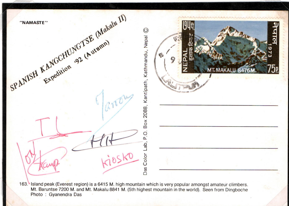
登頂隊員のサイン入り記念はがき(1992 秋)