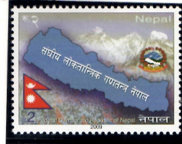
ネパールの地図とエヴェレスト