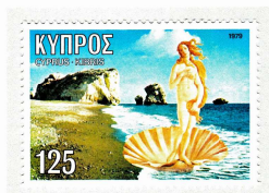
ヴィーナスとキプロスの海岸 キプロス 1979