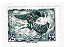
ゼフィロス ギリシア 1943

名画《ヴィーナスの誕生》ポッティチェリ画（ウフィツィ美術館蔵 フィレンツェイタリヤ）の絵は、左からゼフィロスがクロリス（花の精）を抱き、ヴィーナスに風を吹きかけている。ポッティチェリは、ギリシア神話で語られているとおりその様を《ヴィーナスの誕生》で描いている。