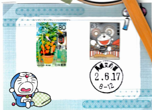
ふるさと 東京 谷津市 2002