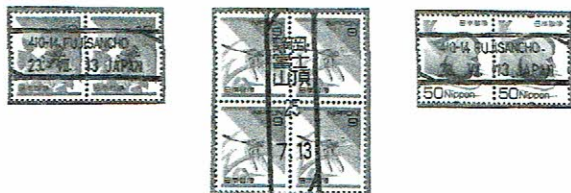
季節局 富士山頂局 開局記念