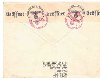
裏面 コピー(70%) ナチスドイツ検閲封緘紙+検閲印

貼付切手・郵便料金の説明 ドイツ宛 普通郵便 KOB(31.7.40) 赤十字条約75年記念 2銭横4枚スリッパ + 4銭 + 日光国立公園 + 4銭縦P 合計20銭 国際郵便料金・書状料金 20銭(20g迄)