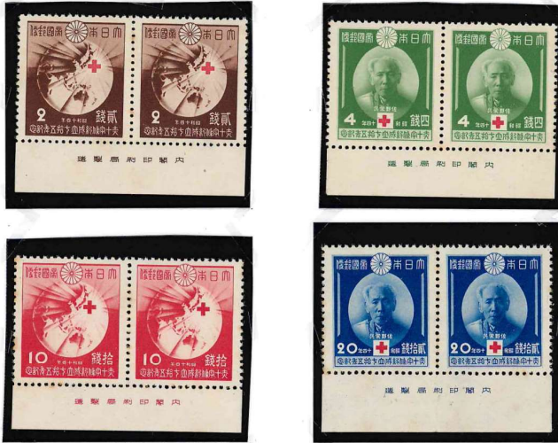
4種のシート構成は縦5枚×横10枚の50面シート。銘板は45・46切手下部に2枚掛けて印刷