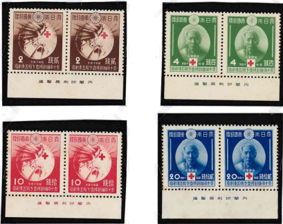
4種のシート構成は縦5枚X横10枚の50面シート。銘板は45・46切手下部に2枚掛けて印刷