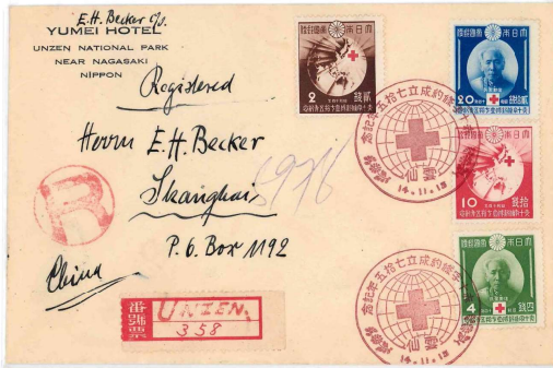
中国宛初日特印書留郵便 雲仙昭和14年11月15日 4種合計36銭 国際書状料金20銭+書留料金16銭 作品の説明

昭和14年(1939)は、赤十字条約が締結されてから75周年です。赤十字国際委員会はこの年の11月15日を“赤十字デー”と定めて75周年の記念祝典を催す事に成り日本でも記念切手が発行されました。葉書用の2銭と10銭には地球と光芒が描かれ、書状用の4銭と20銭には日本赤十字社の創立者である佐野常民(1822-1902)の肖像が描かれています。今回の作品は赤十字条約75年記念切手4種を製造面と使用面から展開した作品です。