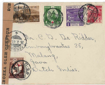
裏面 コピー(70%) オランダ検閲封緘紙+検閲印

貼付切手・郵便料金の説明 オランダ宛 普通郵便 目黒昭和16年2月1日 → CENSUR(25.3.41)着迄52日 赤十字条約75年記念 2銭 + 4銭 + 教育勸励記念 2銭 + 阿蘇国立公園 2銭 + 1次昭和 10銭 合計20銭 国際郵便料金・書状料金 20銭(20g迄)