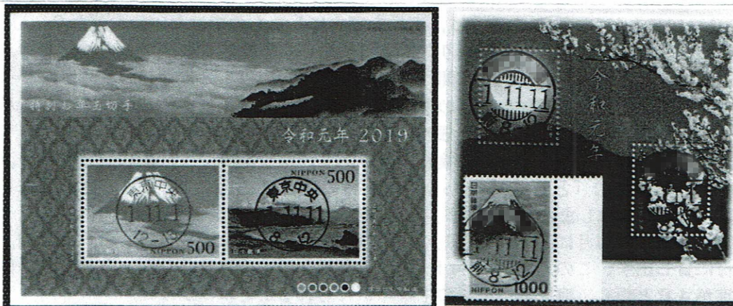
【特別お年玉切手に、東京中央・黒活11・1と11・11の2印】

右側は、この小型シートと、1000円切手+αで、大人の(?)切手交換。小学校以来、久々に切手交換をしました。