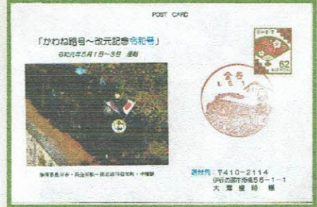
〒410-2114 伊豆の国市南5-1-1 大澤 瑩 様