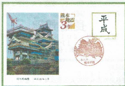
熊本郵便局 平成31年4月