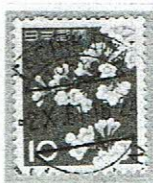
欧文三日月 TACHIKAWA 2.X.61