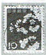
和欧文 川崎 20.2.69