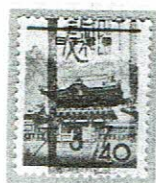
和文ローラ 麴町 37