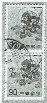
欧文楕円型 YOKOHAMA - II.66