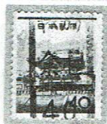
県名カナ入り ヤマト余目 40