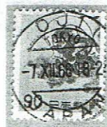
欧文三日月型4区分型 OJI -7.XII.66