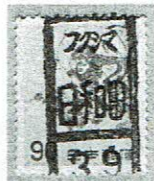
県名カナ入り フクシマ/日和田 39