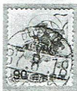
初期使用 西陣 37.8.18