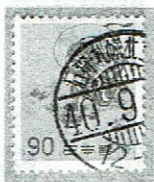
24時間型初期 石狩・札幌北 40.9.-