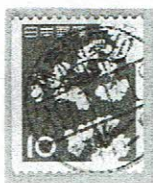
楡型 神奈川県 松山 38 39.11.1-