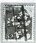
欧文ローラ KANDA 4.VI.68