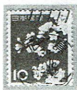
戦後型 広島 38.9.18