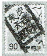
和文ローラ 奈良天理親里館 37