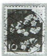
D欄入り 羽後金沢/秋田 37.2.7