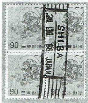
欧文ローラ SHIBA 29.XI.66