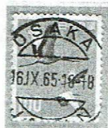
欧文三日月型2時間型 OSAKA 16.IX.65