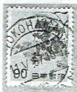
欧文三日月型2時間刻み YOKOHAMA 11.V.67