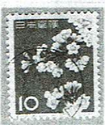
欧文機械 TOKYO 1966/23.IX