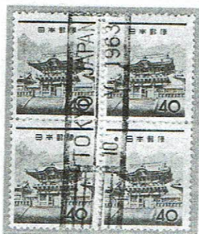
欧文ローラ年4字 TOKYO 10.V.1963