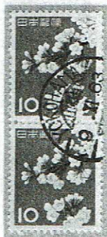
欧文楯型 YOKOHAMA 9.XI.63