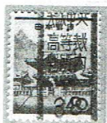
大阪中央/ 高等裁判所内 38