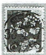
初期使用 東京中央 36.4.7