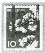
和ローラ 松山 38