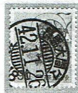
24時間型 群馬・大間々 42.11.26