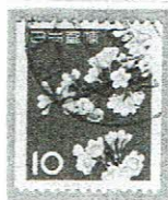
欧文三日月 TOKYO 28.V.62