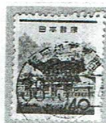
鉄郵 福岡伊万里間 38.3.14