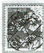
24時間型初期 和歌山印南 40.7.10