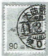
D欄入り 大曲新 ( ) / 秋田 41.2.-