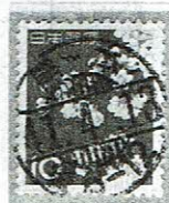
A欄バー入り 熊本 41.4.13