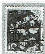
鉄郵 大阪門司間 39.8.1-