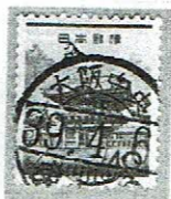
D欄入り 大阪中央/大阪駅内 39.4.6