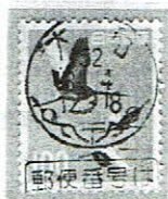
和文機械 大和 52.8.4