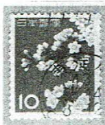
日立 東淀川 43.6.14