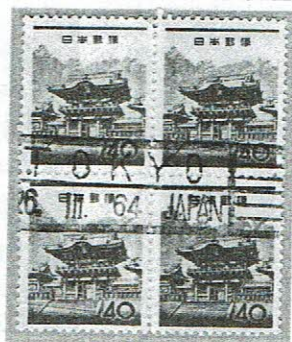
欧文ローラ年2字 TOKYO 26.III.64