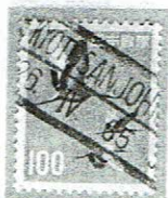
欧文ローラ KYOTO SANJOUH- 26.IV.65