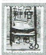
和ローラ 新宿 38