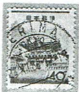
欧文三日月 -ERIMA 24.II.62