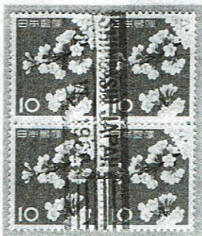
欧文ローラ年4字 SHIMBASHI 16.VI.1962