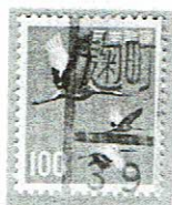
和文ローラ 麴町 39