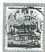
24時間型初期 和歌山 40.10.16