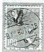
欧文三日月型4区分型 KANONJI 9.IX.63