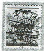
三つ星 大阪福島 38.9.9