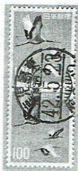
D欄入り 鹿児島県内 42.5.23