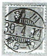
戦後型 品川 39.4.14