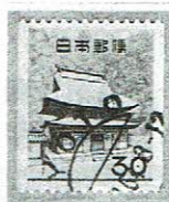
欧文三日月 KYOTO 一.一.64