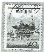
和文機械 旭川 41.6.11