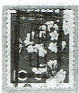
縦書 岡山 (36)