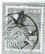
三つ星 長浜 43.6.1