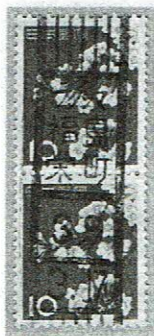
県名カナ入り フクノ/福島栄町 39.3.17