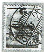
初期使用 川崎 37.5.26