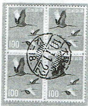
24時間型初期 大阪城東 40.11.22