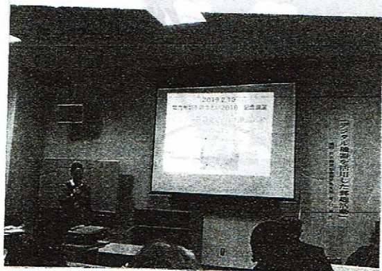
谷之口氏の記念講演