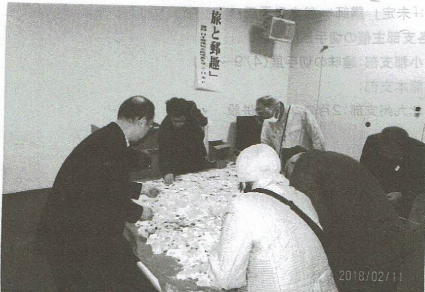
紙付 切手 掘出し